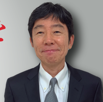
フジテレビ湾岸スタジオビル診療所 院長